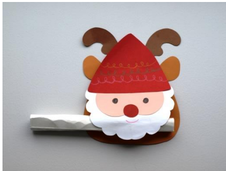
幼児：サンタとトナカイの笛