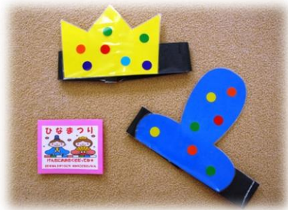
お内裏様、お雛様の冠