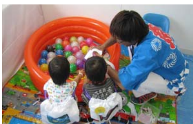
毎月開催される病棟行事の様子 8月は『地藏盆』でした。

病棟保育は入院患者様対象です。保育の提供や絵本の読み聞かせなど、お子さまが安心できるような環境を整え、入院中であっても成長を促せるよう援助しています。