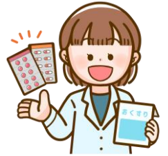
大阪旭こども病院 薬剤師