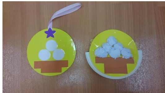
お月見メダル・ゆらゆらお月見ウラ