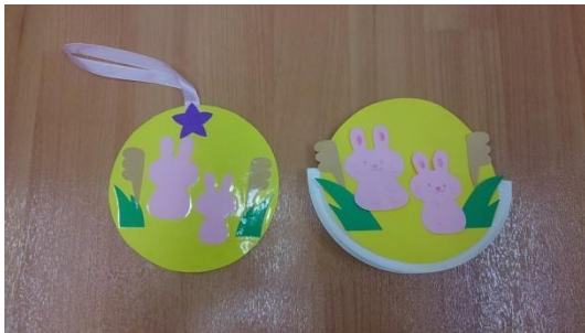
お月見メダル・ゆらゆらお月見オモテ