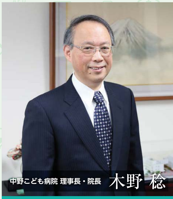
中野こども病院 理事長・院長

「中野こども病院は、何をしているのか? 何を目指しているのか?」を知っていただき、心身の健全な成長につながる「幸せの種」をまきたいと思っています。当院でできることは何でもします。理解し協力していただきたいことは、素直に皆さまにお願いします。どうぞ、みんなでこの広報誌を育てていきましょう。